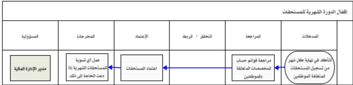
شكل رقم / ٥

يوضح المخطط البياني التالي ( شكل رقم/٥) طريقة تسلسل العمل لإقفال الدورة الشهرية للمستحقات: